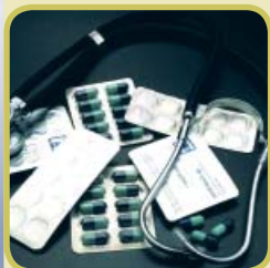
Unverzichtbar in der Patientenversorgung: Tabletten-Verpackungen, Blutbeutel und Bodenbeläge aus PVC